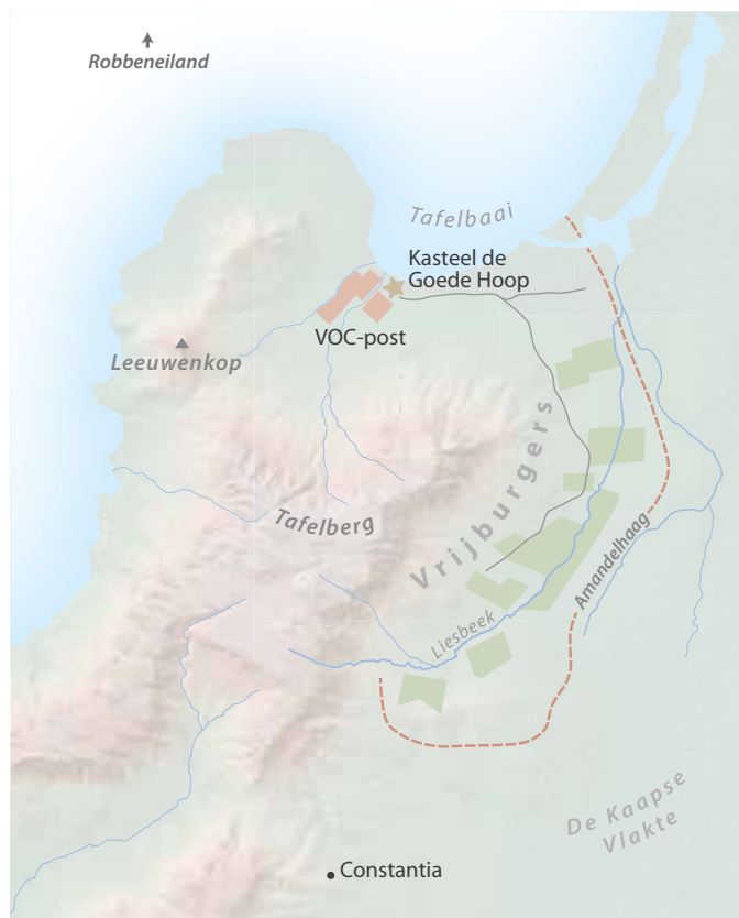
Deze kaarten van de Kaap en Zuid-Afrika geven informatie weer uit verschillende perioden. Globale weergave van de grenzen van de Kaap in 1700 (rode lijn), 1746 (oranje lijn) en 1778 (groene lijn)