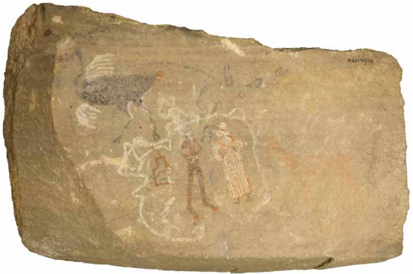
2.1 Steen met een afbeelding van een man en een vrouw, door San geschilderd, 19e eeuw