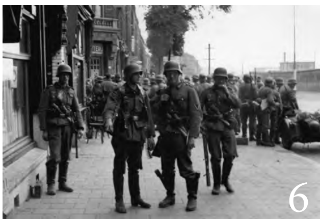
6. Buiten café De witte ballons in de Rosestraat maken soldaten van de 6e compagnie zich gereed voor het eindgevecht om de stad.