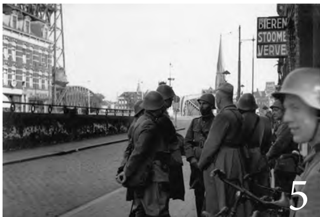
5. Gevangengenomen Nederlandse officieren in de Van der Takstraat