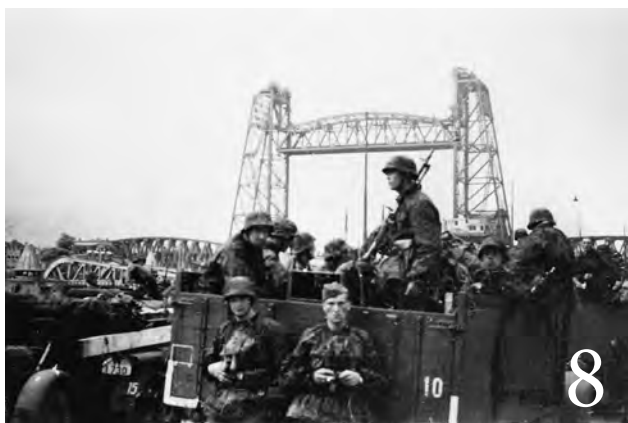
8. De Leibstandarte SS 'Adolf Hitler' rukt verder op richting Maasbruggen.