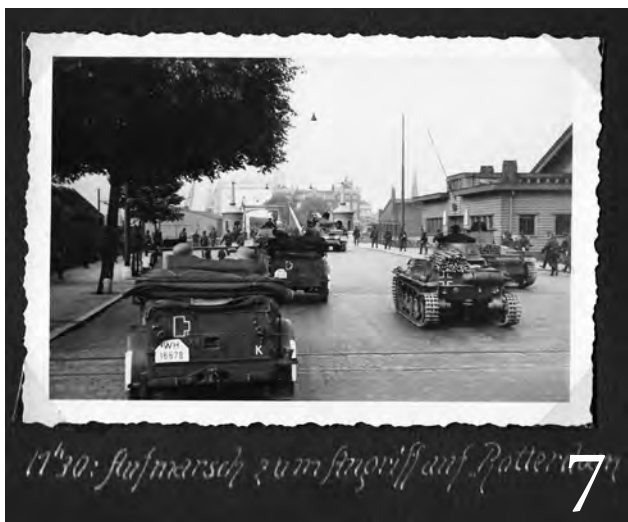
7. De in Rotterdam verzamelde Duitse troepenmacht komt in de ochtend van 14 mei 1940 in beweging en rukt op naar posities om de stad later te kunnen aanvallen. Foto uit een fotoalbum van een van de soldaten van de 3e Zug van het Regiment Nachrichten 85 van de 9e Panzer-Division. Het tijdstip geeft de Duitse tijd aan, de Nederlandse tijd is op dat moment 09.50 uur.